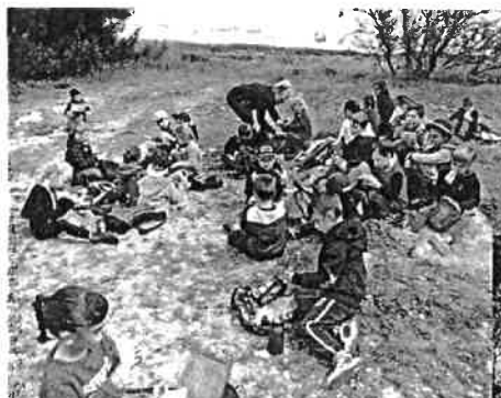
Le CAP d'Ouveillan au grand complet

À dans un an pour la troisième édition des Foulées qui s'élancera de Sallèles d'Aude.