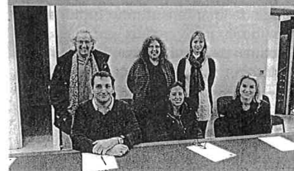
L'équipe des Agents Recenseurs 2018